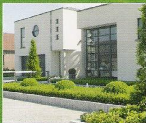
Categorie < 250 m 2