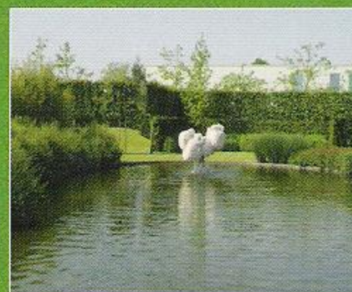
Categorie > 1000 m 2