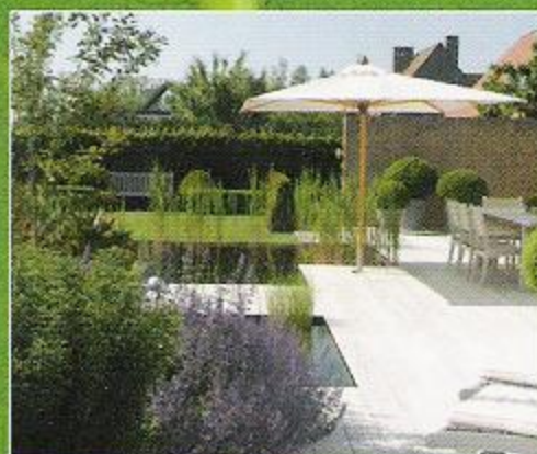
Categorie 250 - 1000 m 2