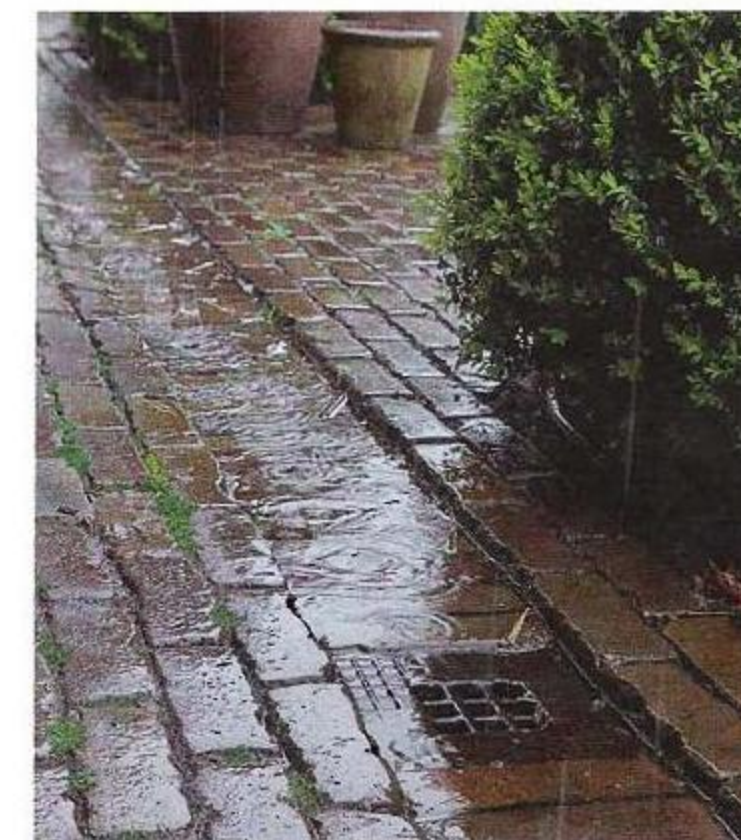
Regenwater dat direct van het dak op de terrassen stroomt, wordt door een in de bestrating verwerkte goot afgevoerd richting riool.