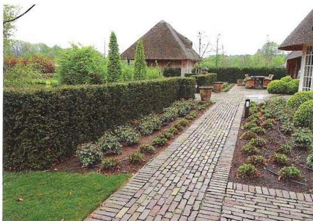
Voor de paden en terrassen in de tuin koos Winters een bronskleurige, oude gebakken dikformaat straatsteen.