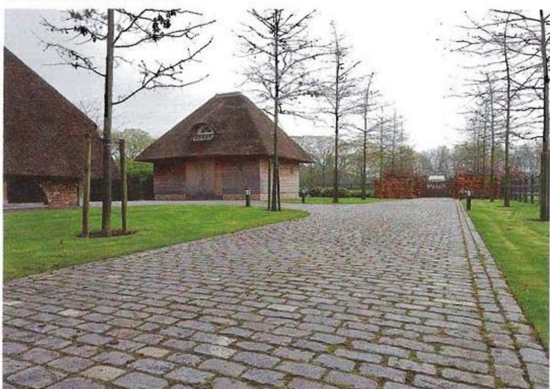
De lange oprijlaan is uitgevoerd in porfierkasseien. Winters gebruikt graag dit soort oude bestratingmateriaal. „Veel komt van trottoirs uit Brussel of Antwerpen. Dat materiaal is al meer dan honderd jaar mooi en blijft dat ook.”