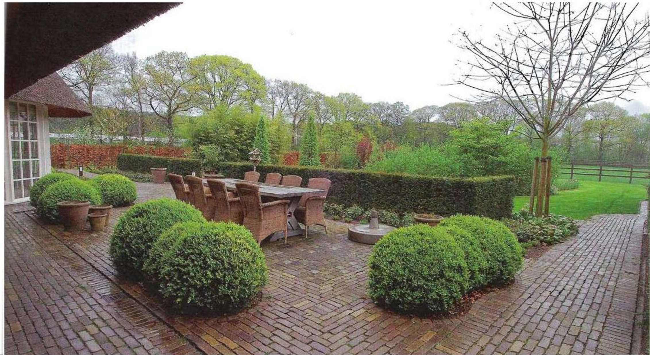
Onder de tuintafel liggen dunne zogenaamde platinen. Deze hebben dezelfde uitstraling als de kasseien van de oprit maar zijn dunner. Ze vormen als het ware een tapijt in de bestrating en zijn in mortel vastgelegd.

Diverse pompen zorgen voor circulatie van het water. Behalve dat hierdoor het water via buffers van lavastenen wordt gezuiverd, beïnvloedt de circulatie ook de watertemperatuur. „Het water in het ondiepe deel van de vijver warmt al vroeg in het seizoen op. Doordat de pompen het warmere water in het zwembegedeelte laten uitkomen, kun je hier in april al aangenaam zwemmen”, aldus Winters. ■