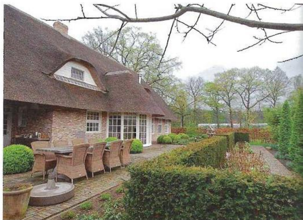
De brede taxushaag benadrukt de breedte van het huis.