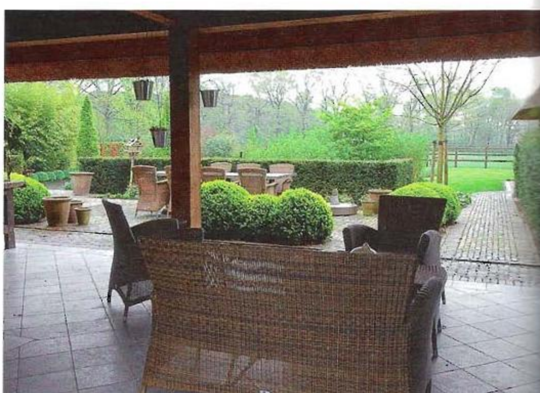
Een groot deel van het terras is overdekt.